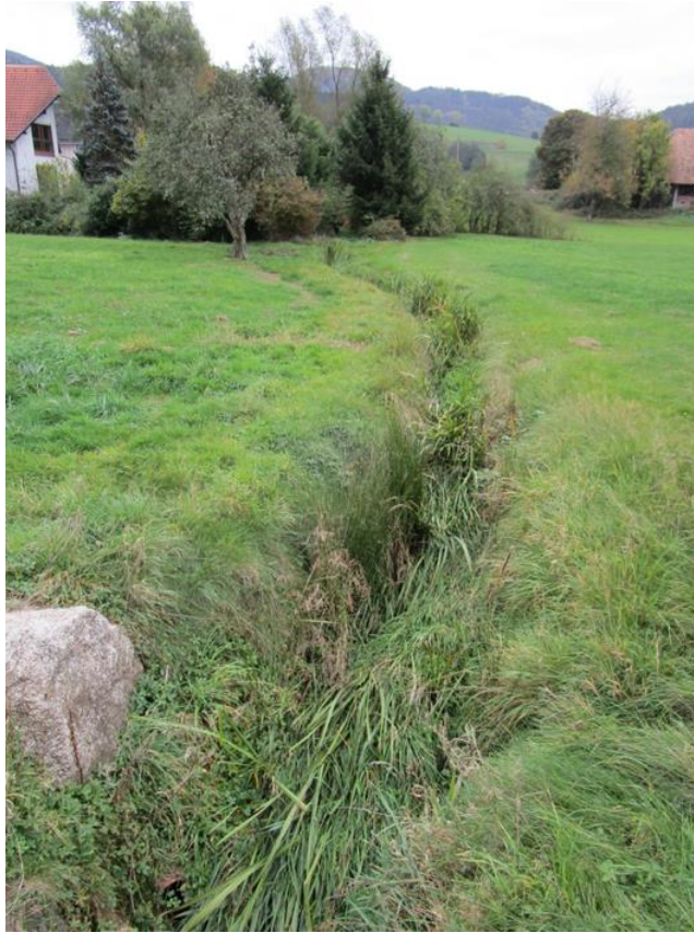
Abb. A4: Grasreiche Ruderalflur zwischen Bundesstraße und Radweg/Fußgängerweg, der die westliche Grenze des Plangebietes darstellt