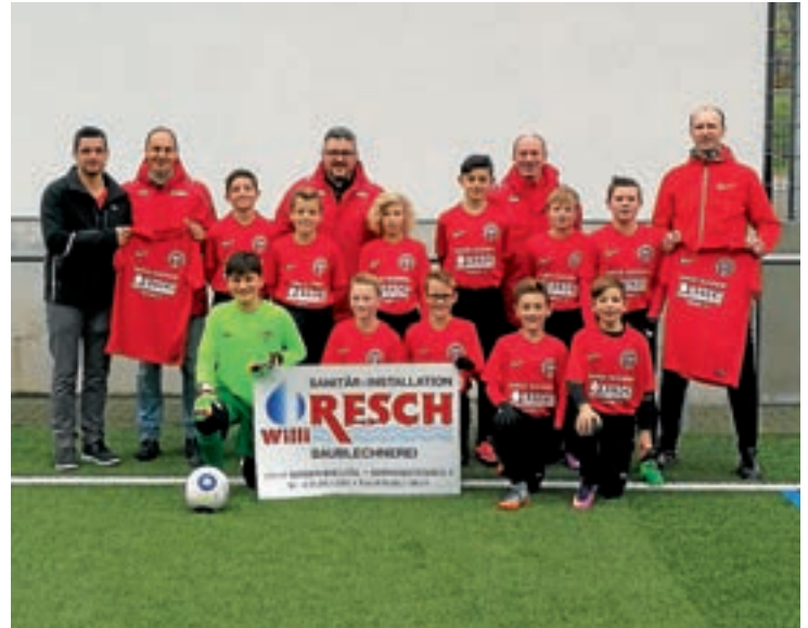
Text und Bild: Alexander Bartholomä

Die SG-Partner SF Winden und SF Elzach-Yach freuen sich mit den D1-Junioren über die neuen Trikots und bedanken sich bei der Firma Sanitär und Blechnerei Willi Resch aus Winden für die großzügige Spende.